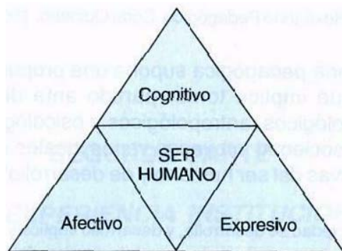
El Triángulo Humano. De Zubiria Samper, 1997.

La primera pregunta la responde con la "subteoría del triángulo humano", según la cual la subjetividad humana está conformada por tres sistemas: el cognitivo, el afectivo y el expresivo; en otras palabras, por las ideas y conocimientos (ideología), los valores y afectos (axiología) y los códigos y comportamientos (lenguaje). Esto es, EL SABER, EL SER Y EL HACER, respectivamente.